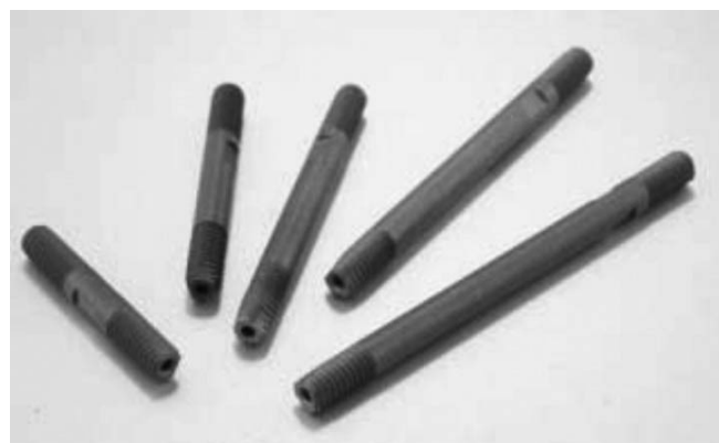
3: Voorbeeld van een fixatie-schroef