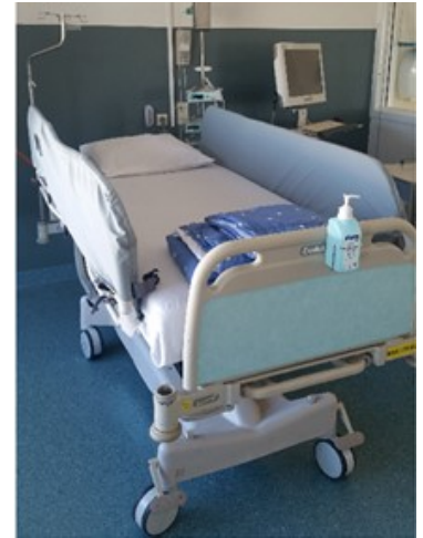
Afbeelding 3. Bedhoezen

Wanneer er voldoende aanvallen geregistreerd zijn, kunnen er extra testen bij u worden afgenomen door middel van elektrische stimulatie. Hierbij worden de elektrodes één voor één door de KNF-laborant gestimuleerd met kleine stroomstootjes en wordt vastgelegd hoe u hierop reageert. Soms wordt dit onderzoek mede uitgevoerd door een neuropsycholoog. Dit onderzoek neemt enkele uren in beslag en kan aanvallen of bepaalde sensaties, bewegingen of woordvindstoornissen uitlokken. Het is over het algemeen niet pijnlijk.